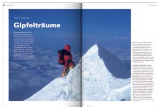
Kunde: SAP SI | Branche: IT | Umfang: 20 Seiten | Leistung: Beratung, Text, Grafik

Ob bei der Entwicklung oder Implementierung betriebswirtschaftlicher Software: Unsere Kundenmagazine für SAP SI sowie das mittelständische SAP-Systemhaus ComSol verraten, worauf es hier ankommt. Durch anschauliche Praxisberichte, ehrliche Interviews und spannende Neuvorstellungen zeigen wir, wie frisch man selbst „trockene Themen“ aufbereiten kann. Und wie viel Spaß es bereitet, darüber zu lesen!