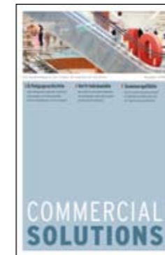
Kunde: ComSol AG | Branche: IT Umfang: 20 Seiten Leistung: Beratung, Text, Grafik